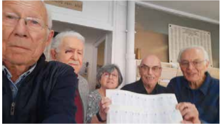
L'équipe en charge du tirage au sort

Les gagnants devront nous faire parvenir les billets correspondant aux numéros tirés au sort et dont la liste sera publiée dans la page départementale de l'Ancien d'Algérie. Les lots non réclamés le 31 août 2026 resteront acquis aux Œuvres Sociales de la FNACA Comité départemental de Paris.