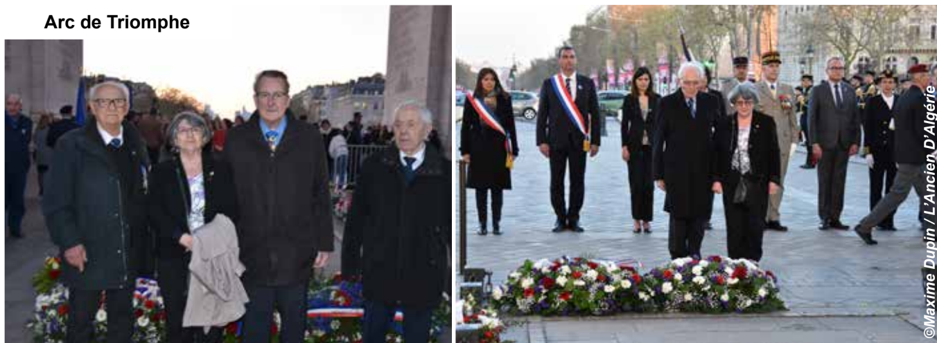
Arc de Triomphe