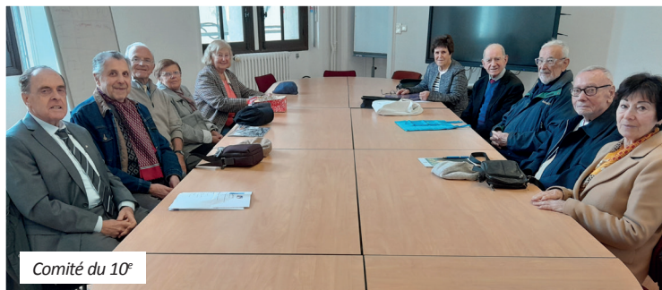
Comité du 10 e