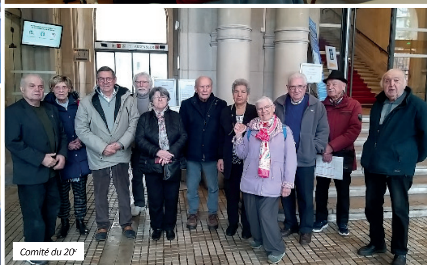
Comité du 20 e