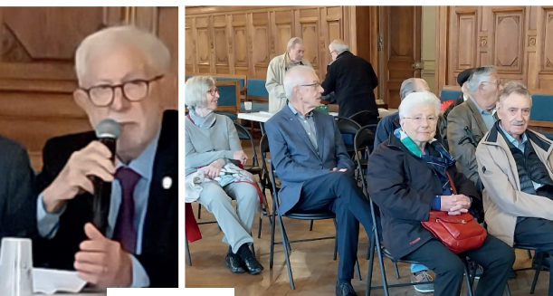
Comité du 14 e