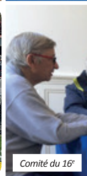
Comité du 16 e