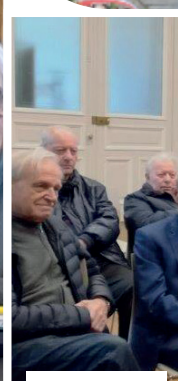
Comité du 15 e