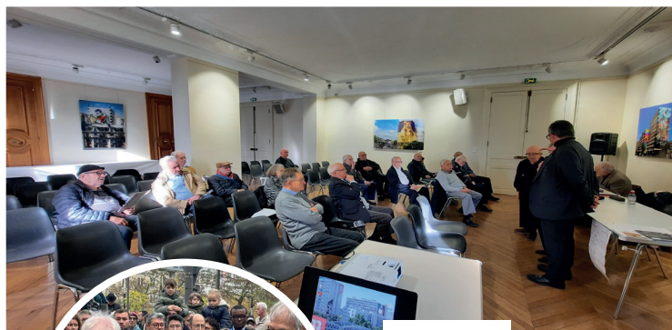
Comité du 13 e