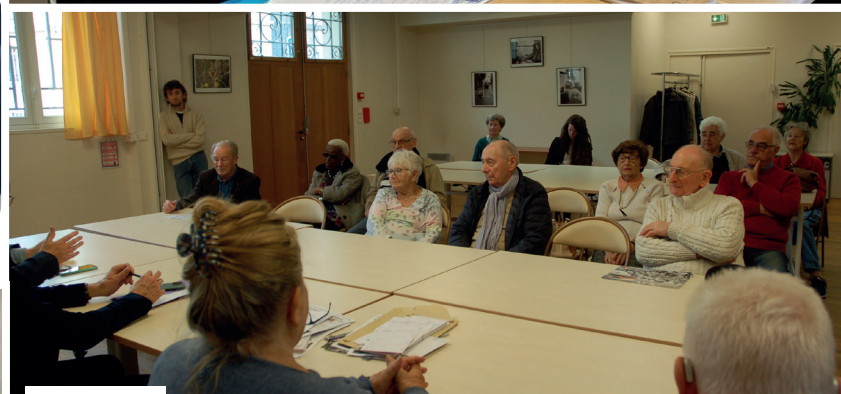
Comité du 19 e