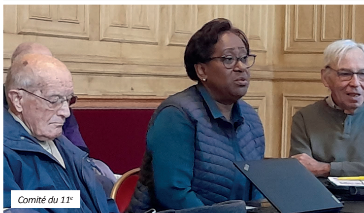
Comité du 11 e