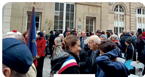
Comité du 9 e