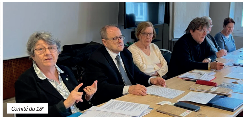
Comité du 18 e