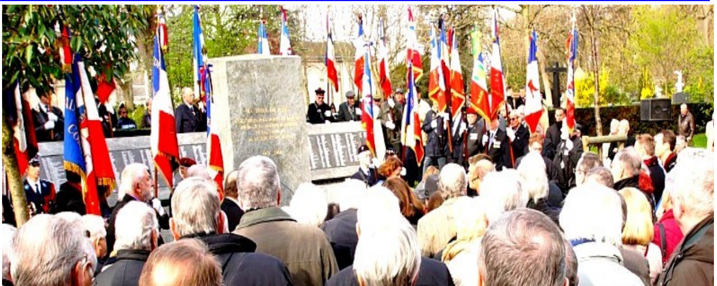
Cérémonie devant le Mémorial parisien en 2018

En raison du contexte sanitaire la commémoration s'est déroulée sans discours et avec une assistance restreinte.