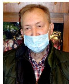
1961 ... et soixante ans après en 2021