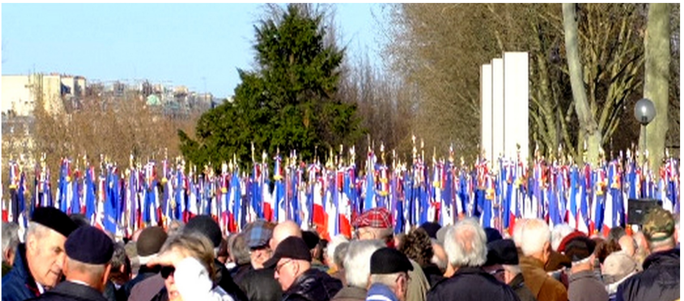
Cérémonie devant le Mémorial National, quai Branly, en 2017