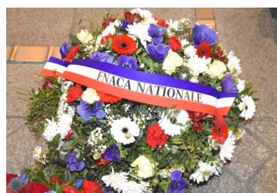
La gerbe de la FNACA