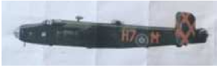
Le Halifax «M pour MIKE» d'André V...