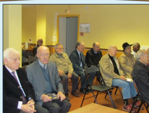
Mairie du 14 ème , Salle polyvalente

Assemblée générale de la FNACA14 13 Octobre 2017, 15h