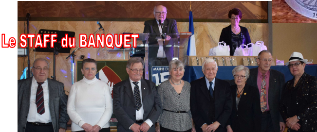
Le STAFF du BANQUET