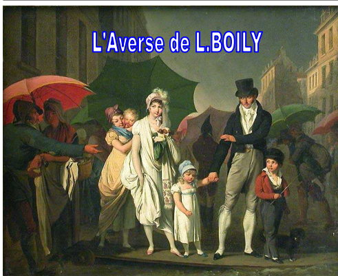
L'Averse de L.BOILY

Heureusement aujourd'hui les trottoirs nous permettent de garder les pieds au sec avec des chaussures qui reflètent les lumières du ciel ou des réverbères et qui n'ont plus à utiliser les grattoirs posés entre chaque porte cochère des immeubles anciens..