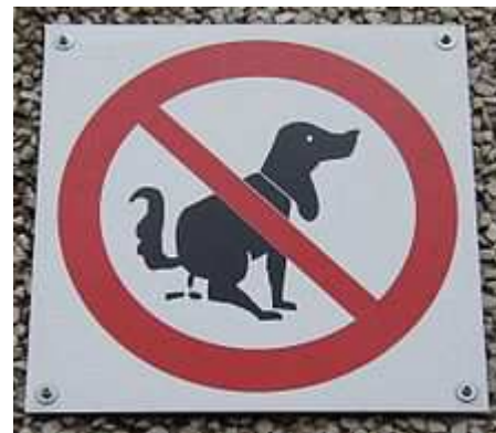
Mais c'est ....à Berlin !