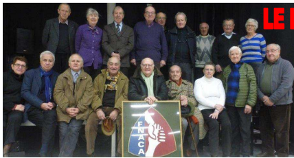
LE BUREAU 2017