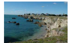
La côte sauvage de la Baule au Croisic