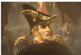
« Le Mot de Cambronne » sur ce gros plan du célèbre Tableau d'Armand-Dumaresq à l'Exposition de 1867

Il meurt dans l'oubli en 1842 à Nantes sa ville natale.