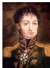
Pierre Cambronne 1770-1842