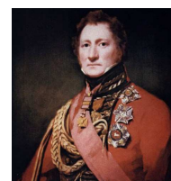
Sir Charles Colville 1770-1843