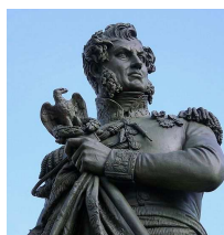
Statue au centre du cours Cambronne à Nantes